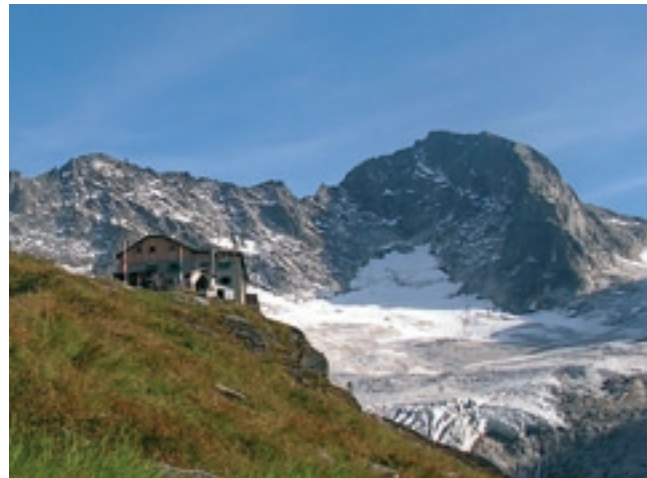
Die Greizer Hütte im Zillertal

www. alpenverein- greiz.de info@ alpenverein- greiz.de